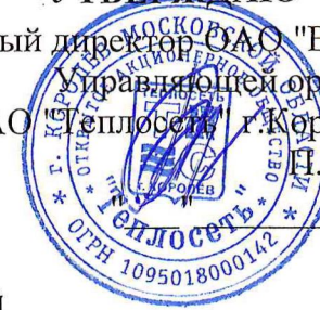
ГРАФИК ОСТАНОВА на профилактический ремонт котельных и тепловых сетей ОАО "Теплосеть" г.Королев М.О. в 2019 г.